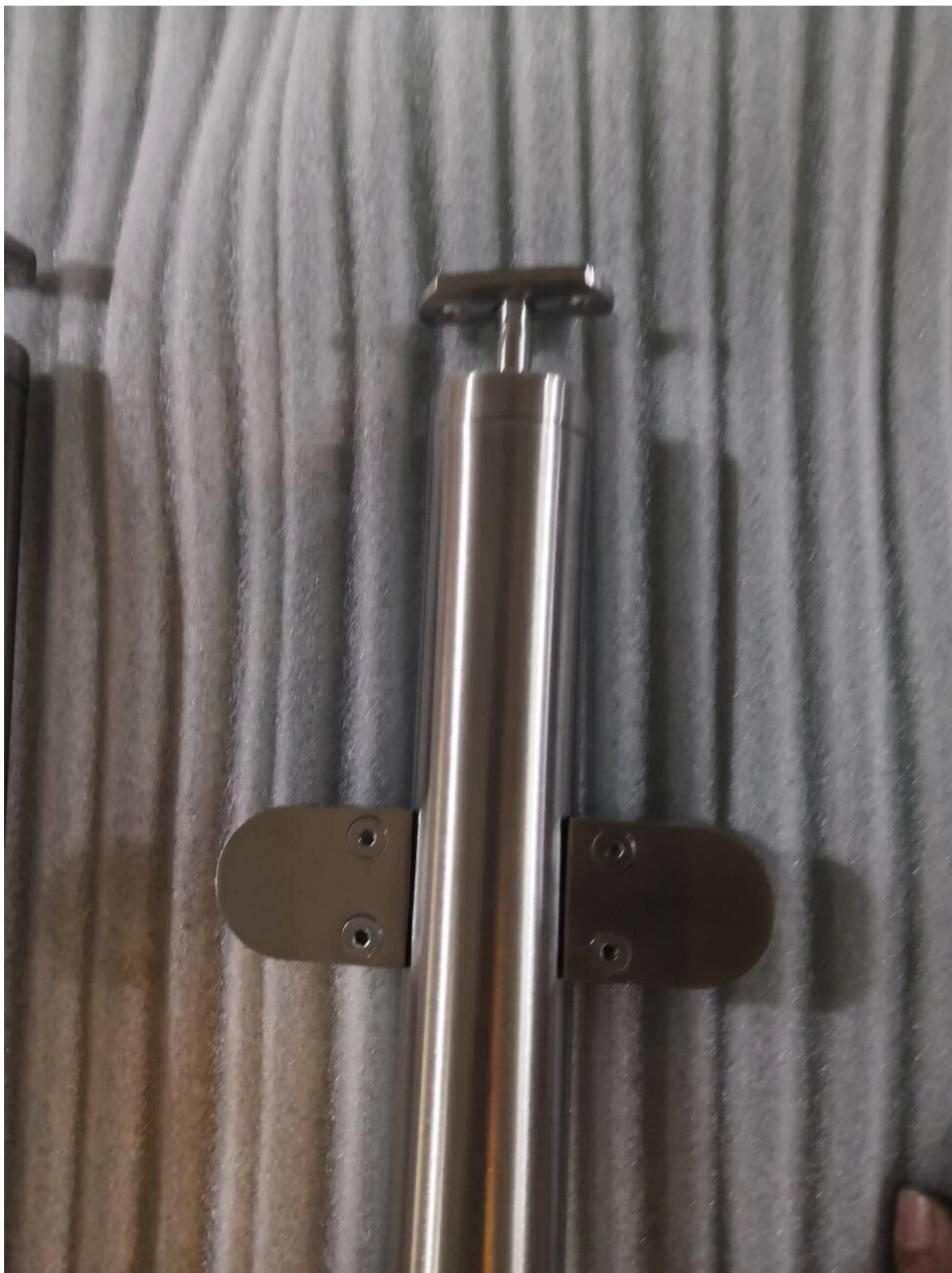
III. Фотографии проекта балюстрады из нержавеющей стали на балконных перилах -