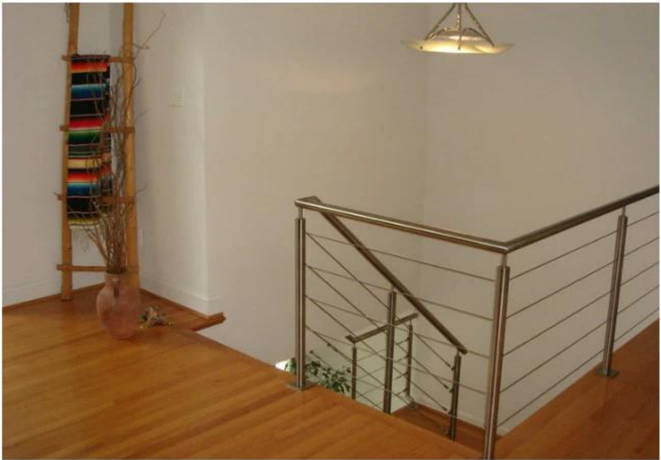
2, трос из нержавеющей стали натяжитель: