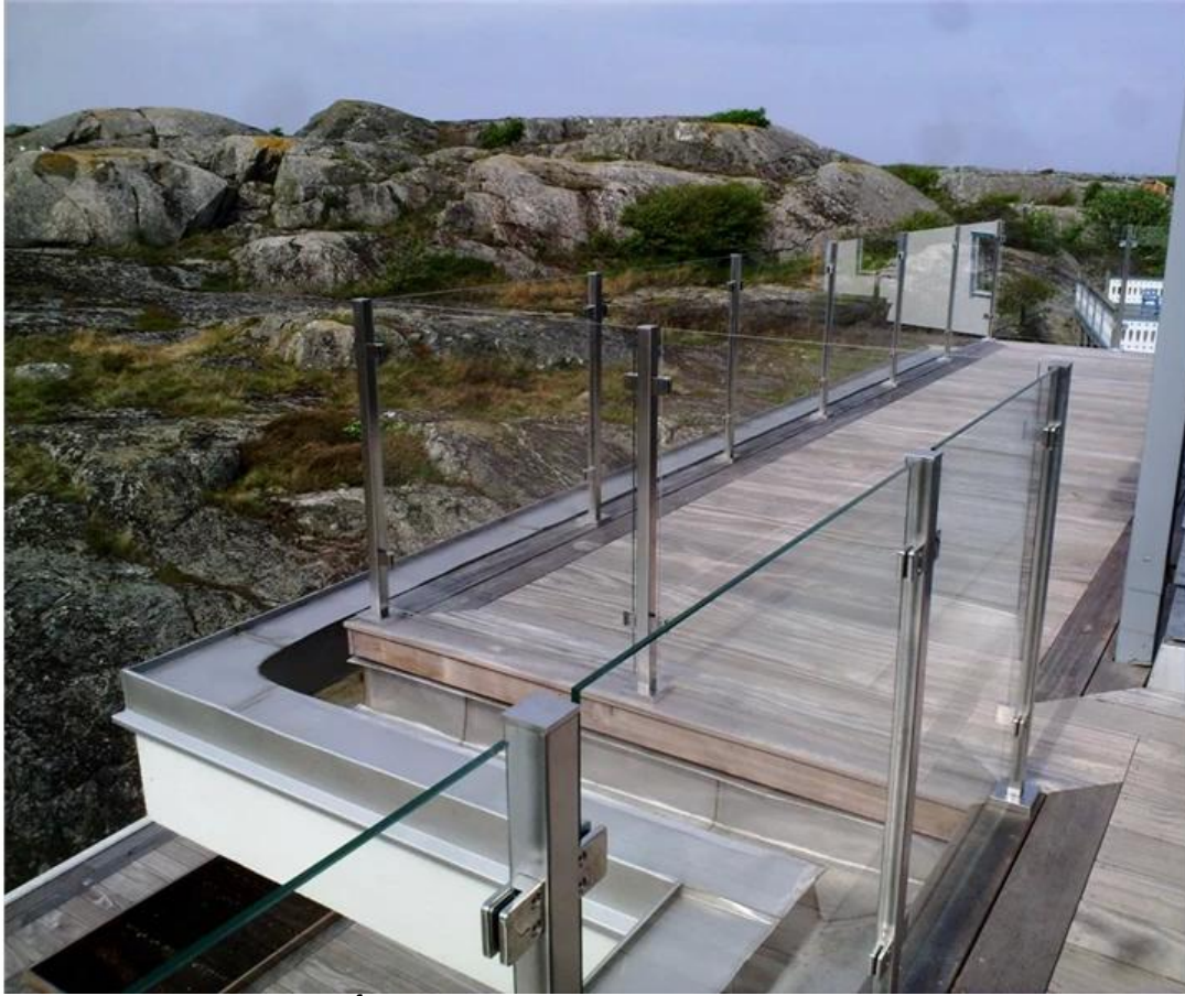
الزجاج مربع تصميم الدرايزين الفولاذ المقاوم للصدأ للسباحة تجمع 50x50 دعم 50