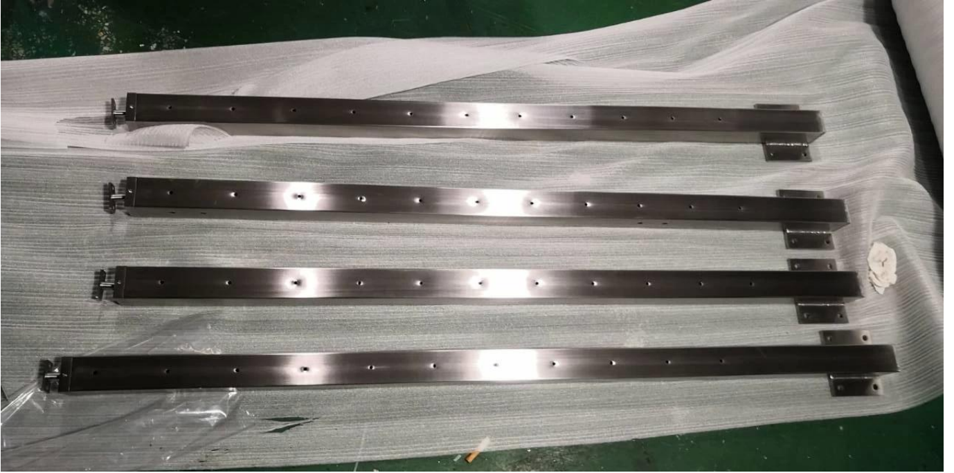
أعلى / وجه جبل الدرايزين المشاركات لأنظمة حديدي الكابلات الفولاذ المقاوم للصدأ