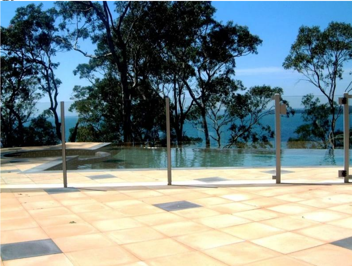
ملم خفف تصميم شرفة الزجاج الزجاج حديدي مع وظيفة الألمنيوم؛ 10-12