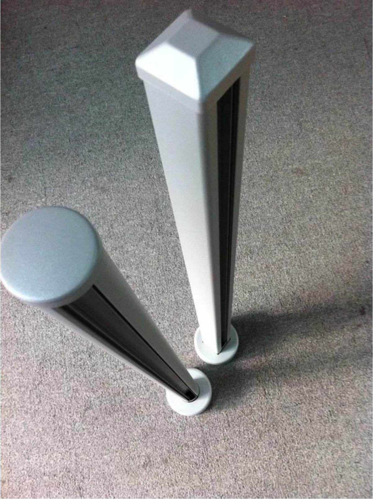
أنواع مختلفة من آخر متاح