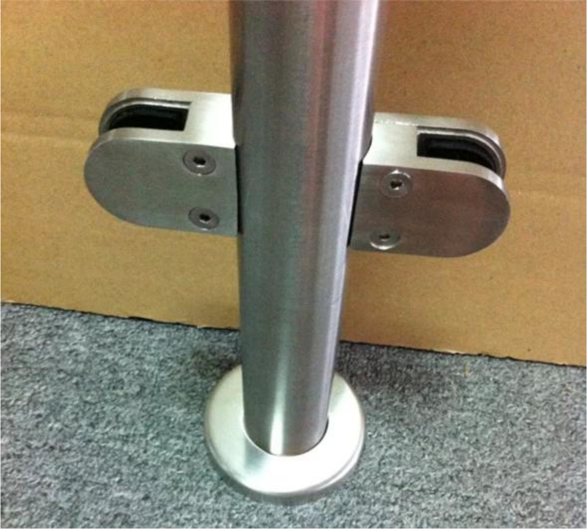
سطح مصقول الفولاذ المقاوم للصدأ