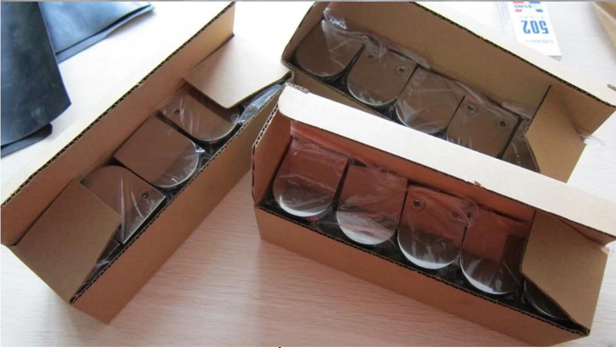
أنواع مختلفة من المشابك الزجاجية ذات الأبعاد: