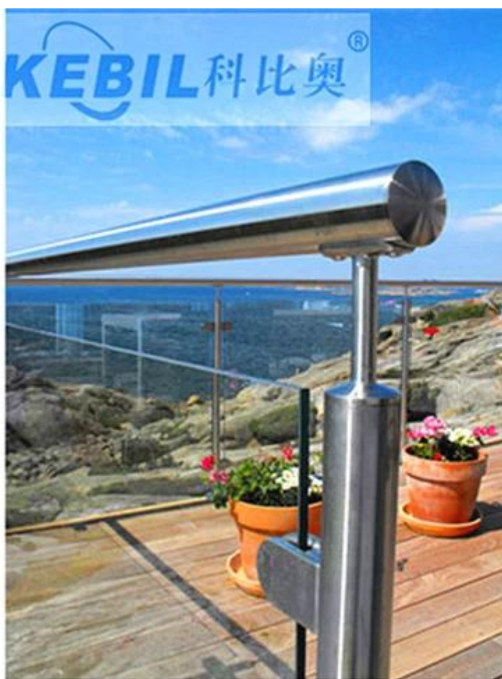
不銹鋼 欄杆 玻璃欄杆