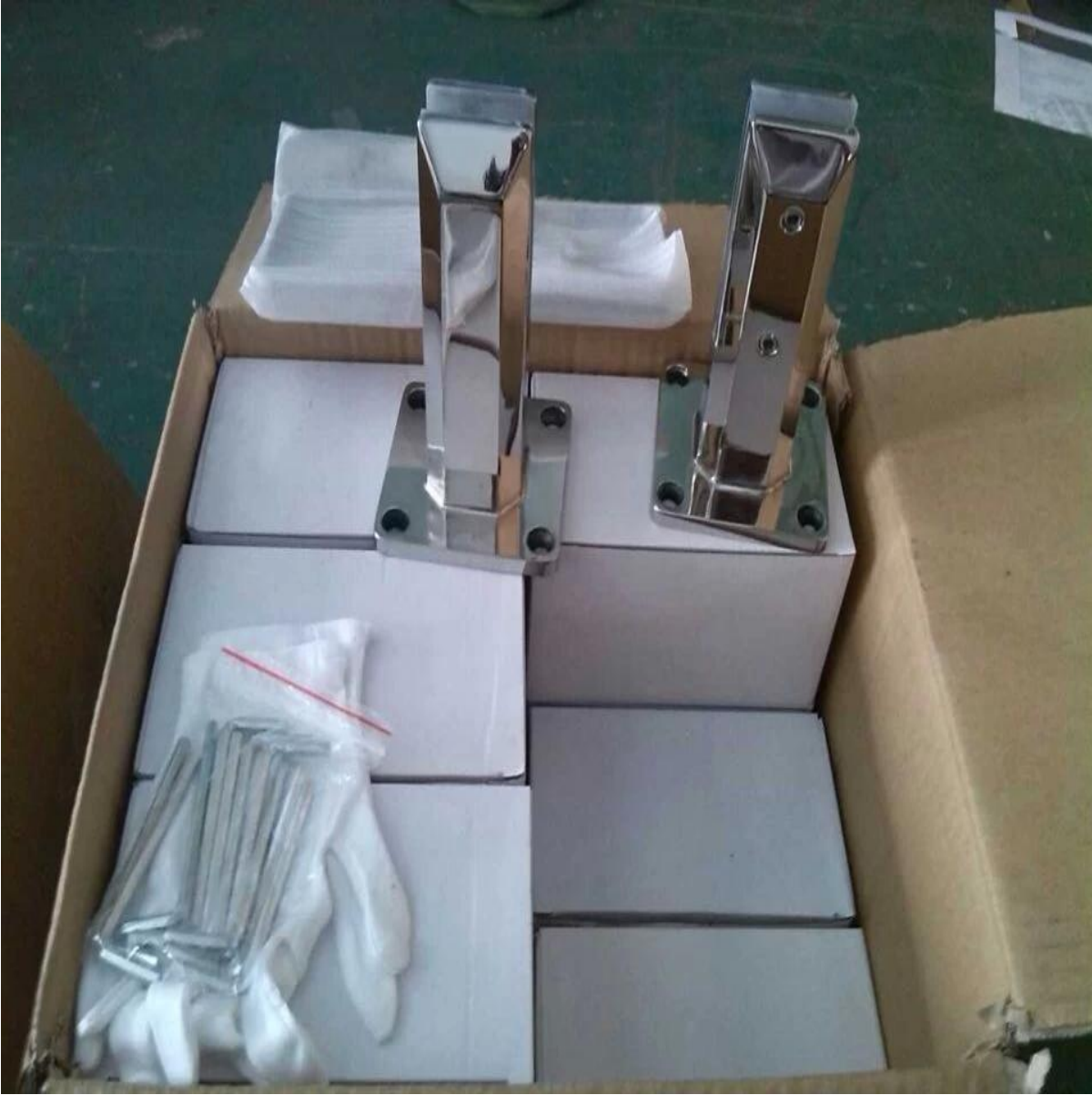
من صنابير الزجاج other.تصميم 2 الوزن الصافي: 1.7 KG * 168mm dia50 جولة قاعدة لوحة من الزجاج حنفية