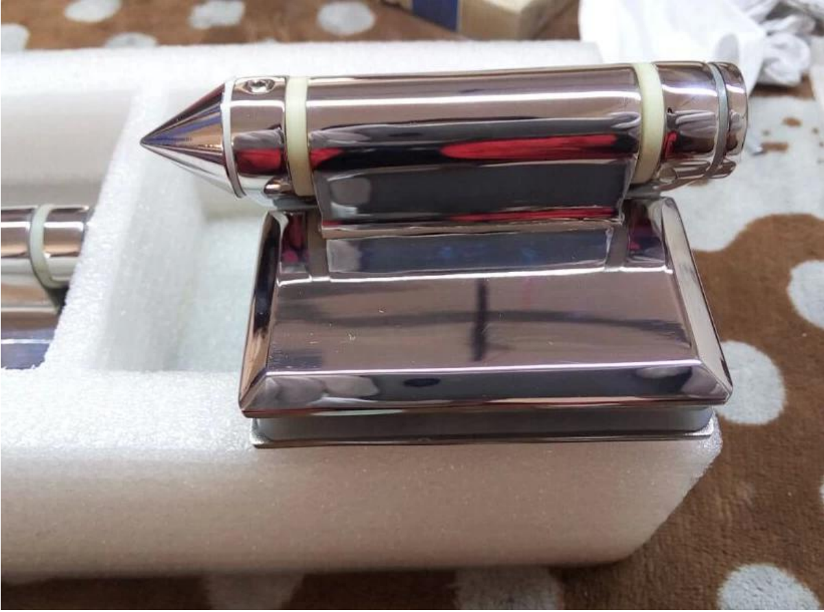
G-G2: مقارنة مع شركائنا العادي المفصلي زجاج :عرض الخلفي من الساتان نحى