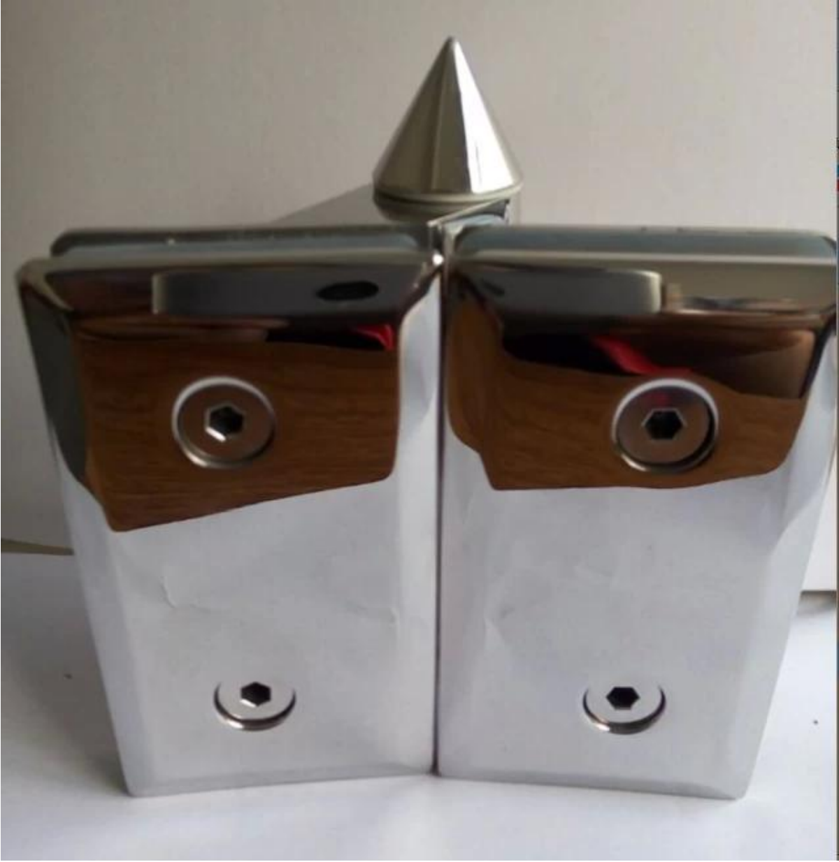
عرض الخلفي مصقول مرآة