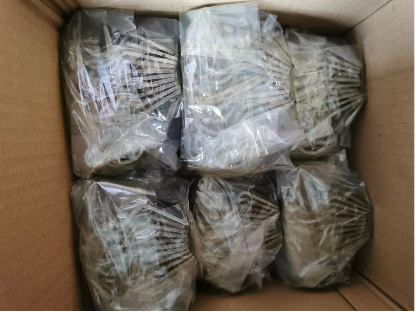
منتجات ختم الصفائح المعدنية