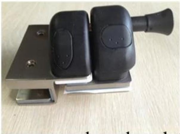
glass door latch