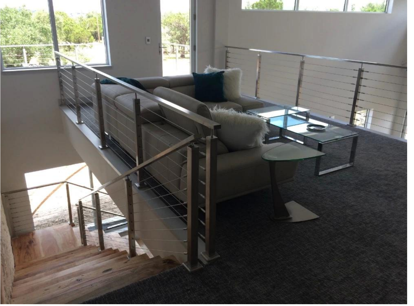
كابل مملوء بالكابل من الفولاذ المقاوم للصدأ مع درابزين خشبي لتصميم درابزين الدرج النموذجي