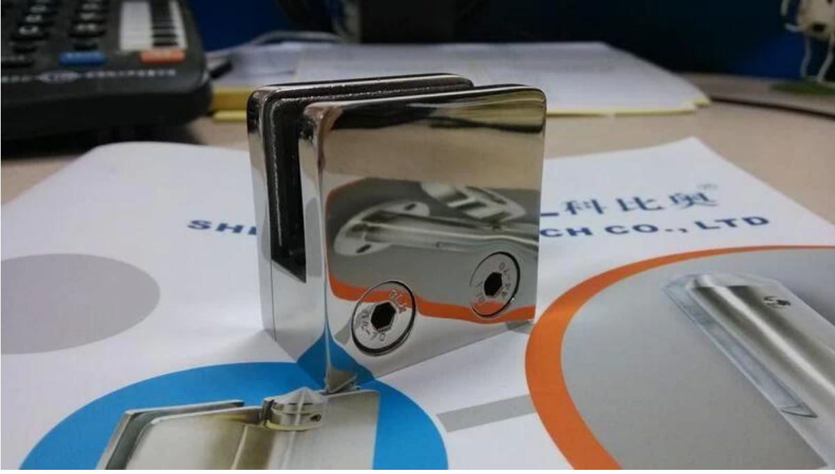
مشروع مثبتة على الفولاذ المقاوم للصدأ حديدي آخر