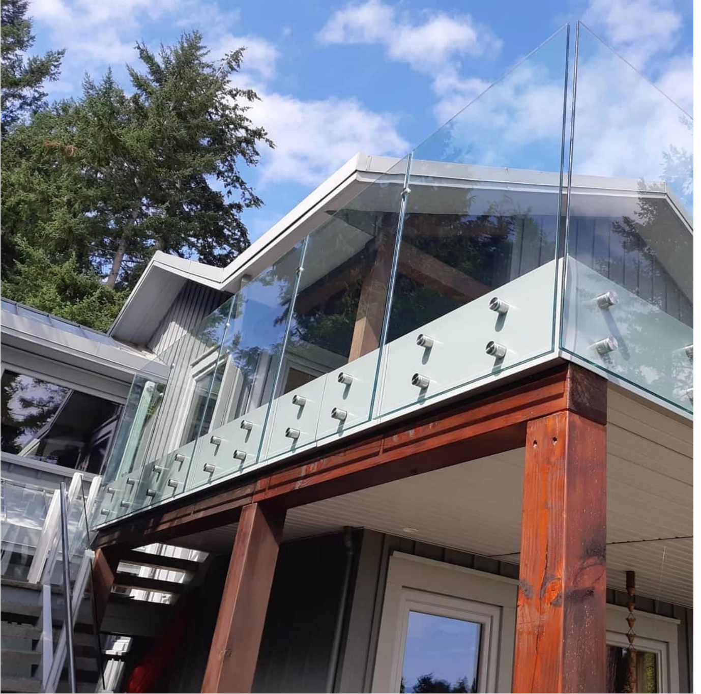
زجاج المواجهة+. أعلى مشقوق درابزين في لون الذهب(3)