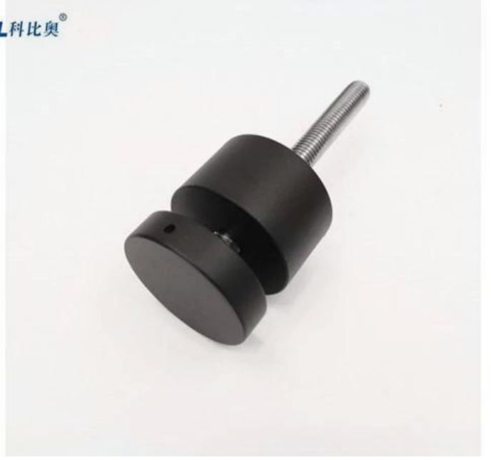
الفولاذ المقاوم للصدأ حزمة إنتاج الزجاج في