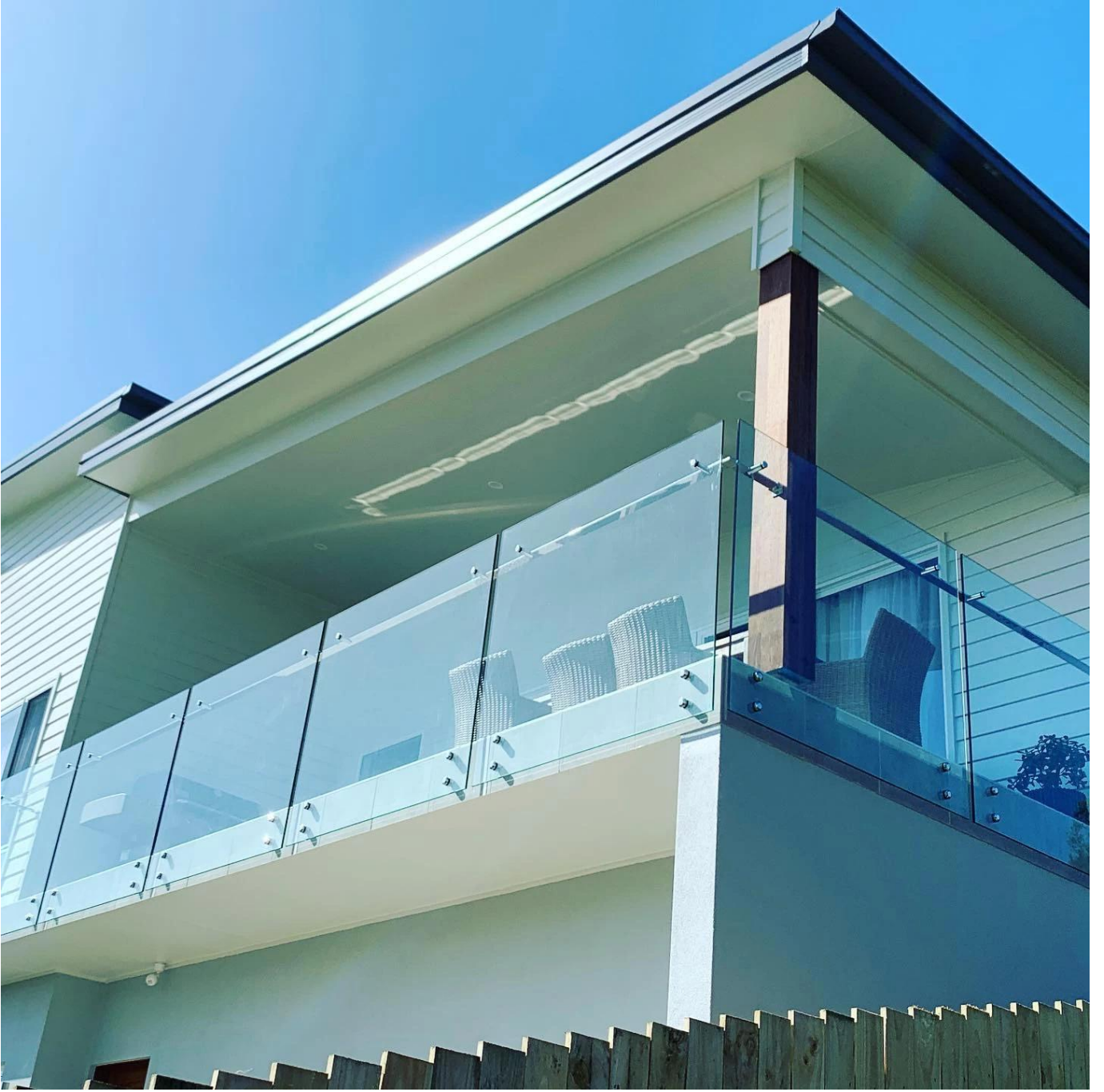
زجاج المواجهة + زجاج المشابك في ما بين (2)