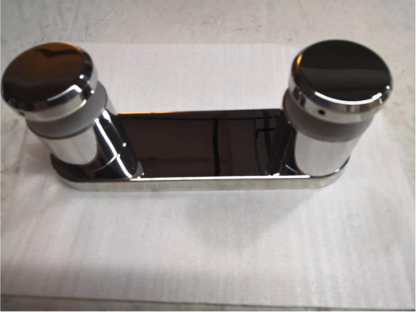
محول المواجهة الزجاجية شديد التحمل للاستخدام مع حديدي زجاجي بسمك 15 مم