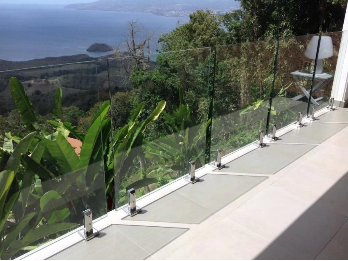
سيم في الانتهاء من الساتان