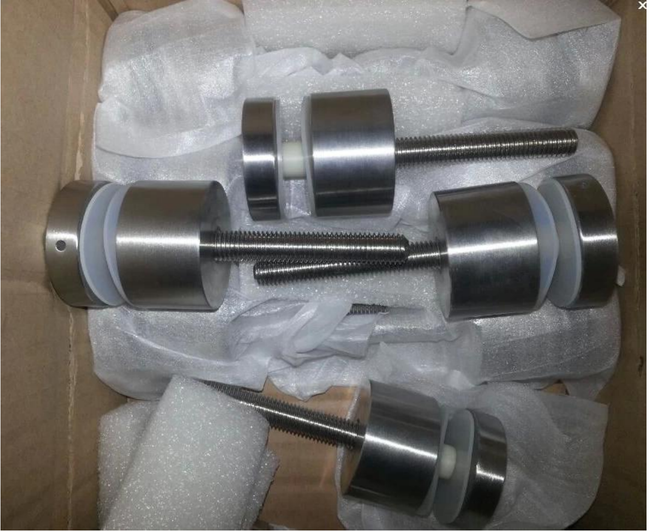
مشروع حديدي للزجاج ستانيليس: