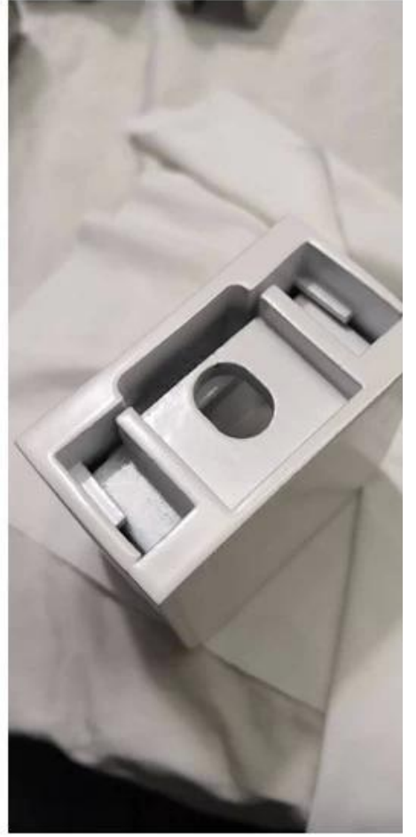
:الانتهاء من إطارات الكهرياء السوداء