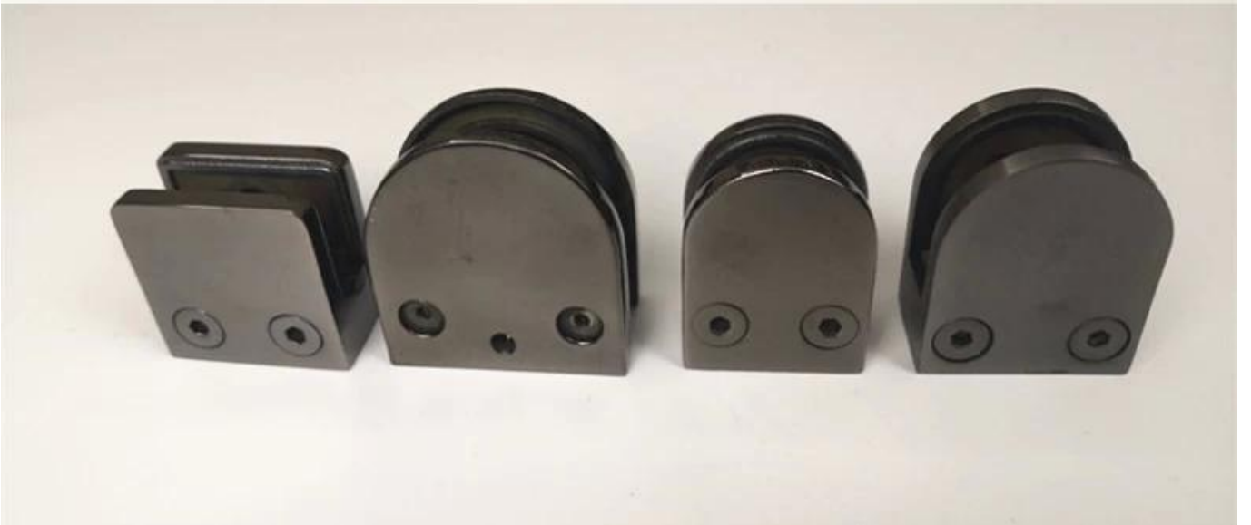
أنواع مختلفة من المشابك الزجاجية بأبعاد: