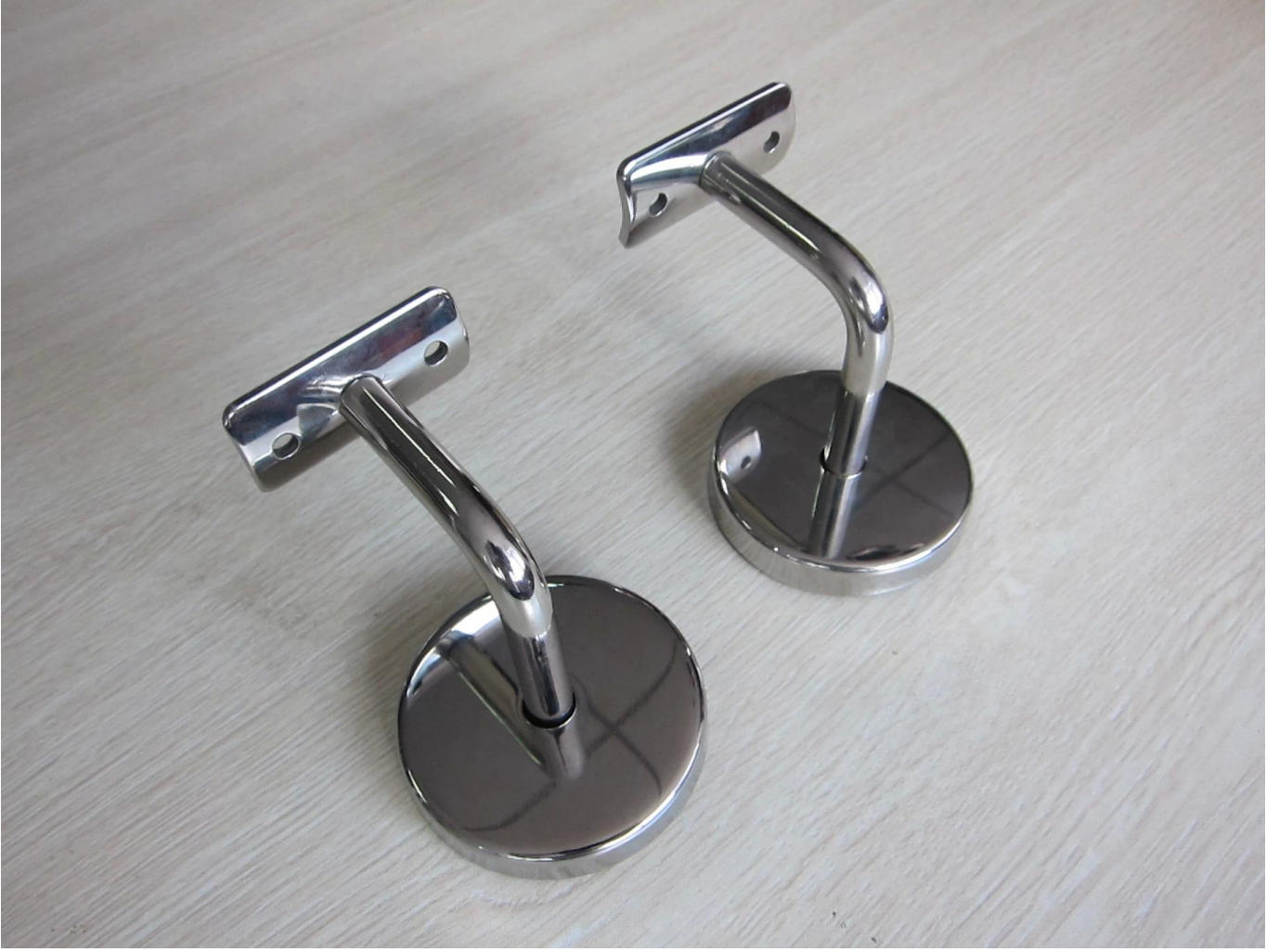
2). درابزين زجاجي من الفولاذ المقاوم للصدأ مثبت على الحائط P706 نموذج رقم .