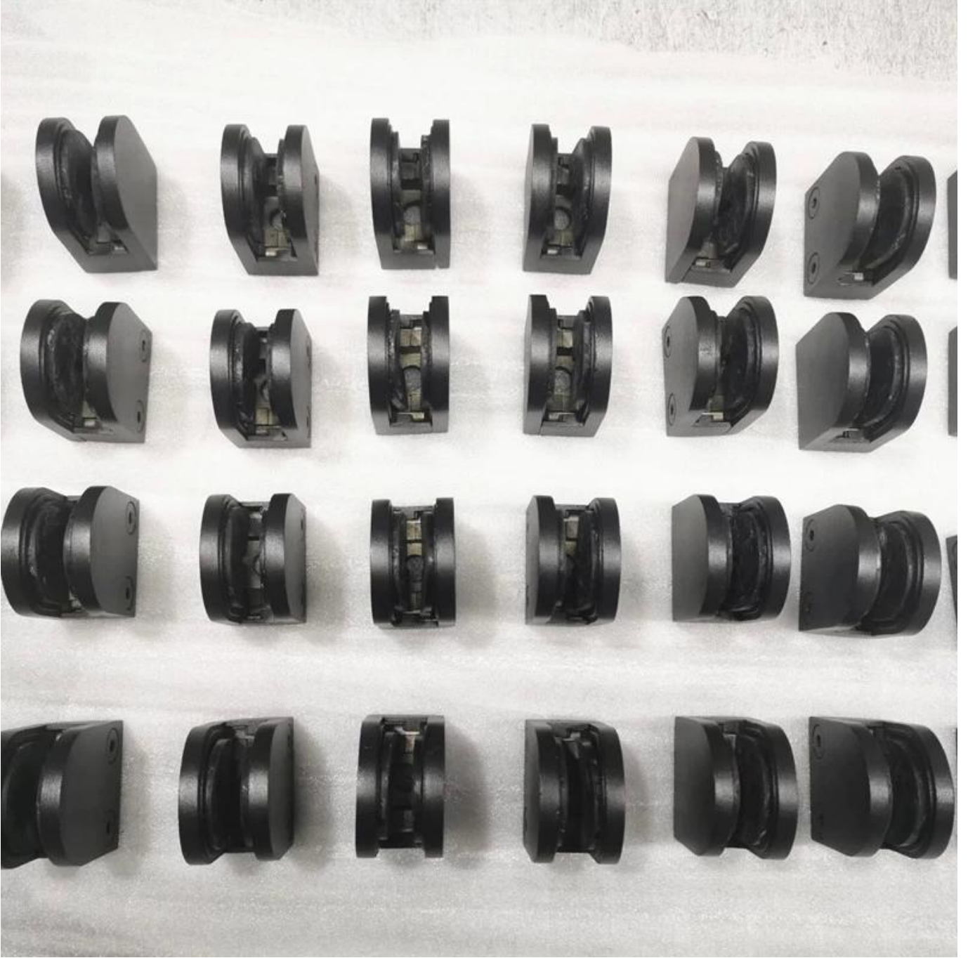
شكل مربع ماتي أسود زجاج المشبك أيضا