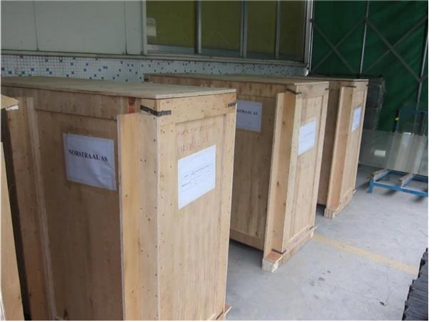
- صور مشروع العملاء من الخشب في الهواء الطلق الفولاذ المقاوم للصدأ 316 زجاج الدرابزين