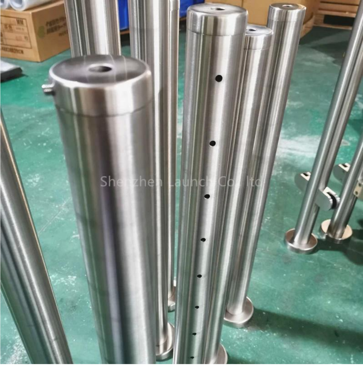
-شدادات الكابلات لتتوافق مع أعمدة درابزين الكابلات