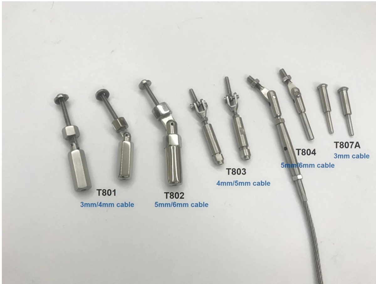
-المشروع الصور من آخر حديدي سطح السفينة الأنظمة