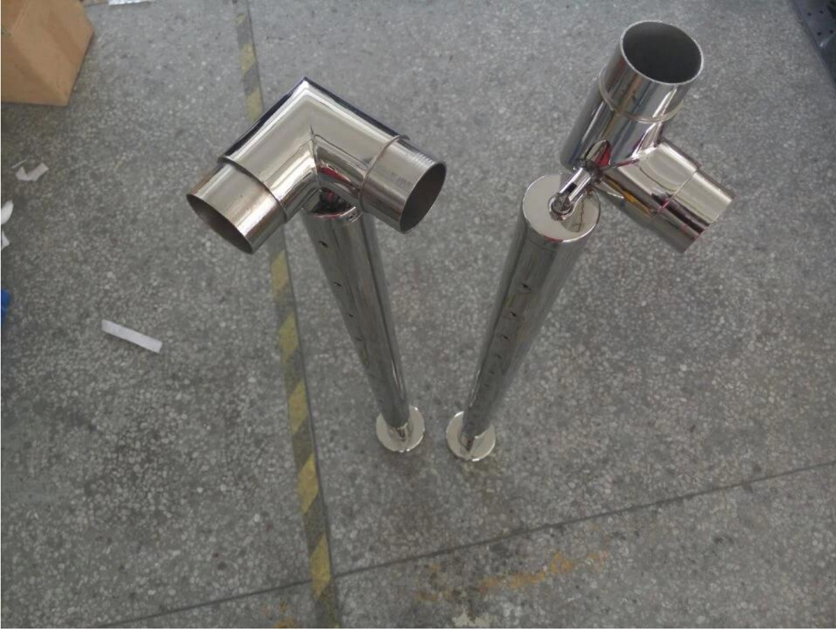
URL: للمعرفة المزيد عن آخر وموصل