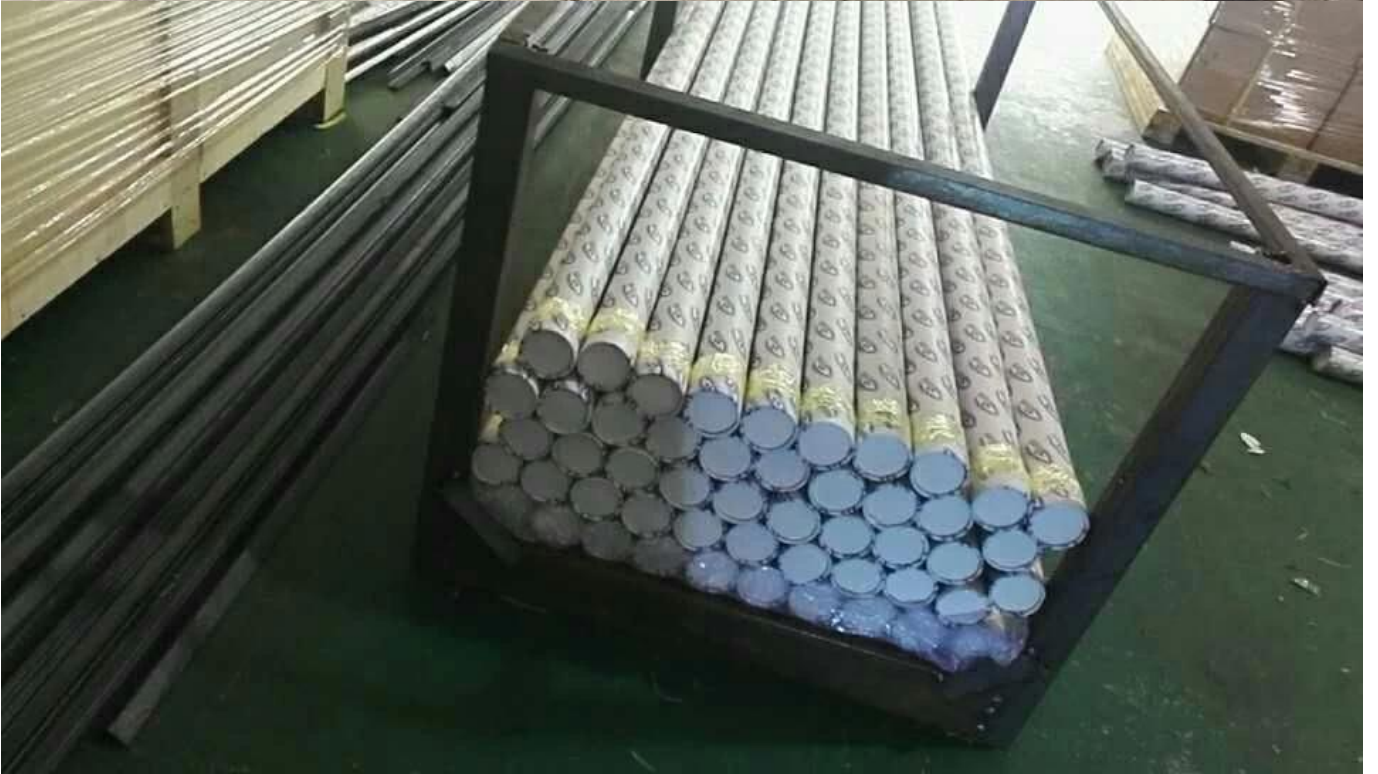
: صور المشروع