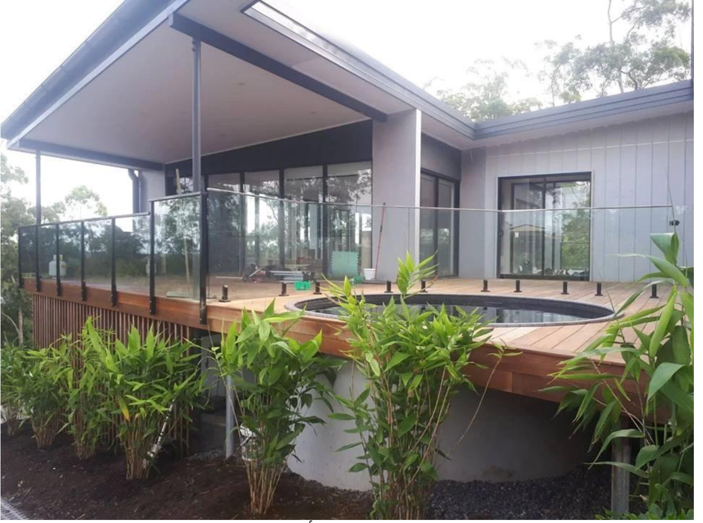
spigot الحروف الساتان الفولاذ المقاوم للصدأ 316 فرملس بركة سياج نحى ساحة الزجاج SBM-3: