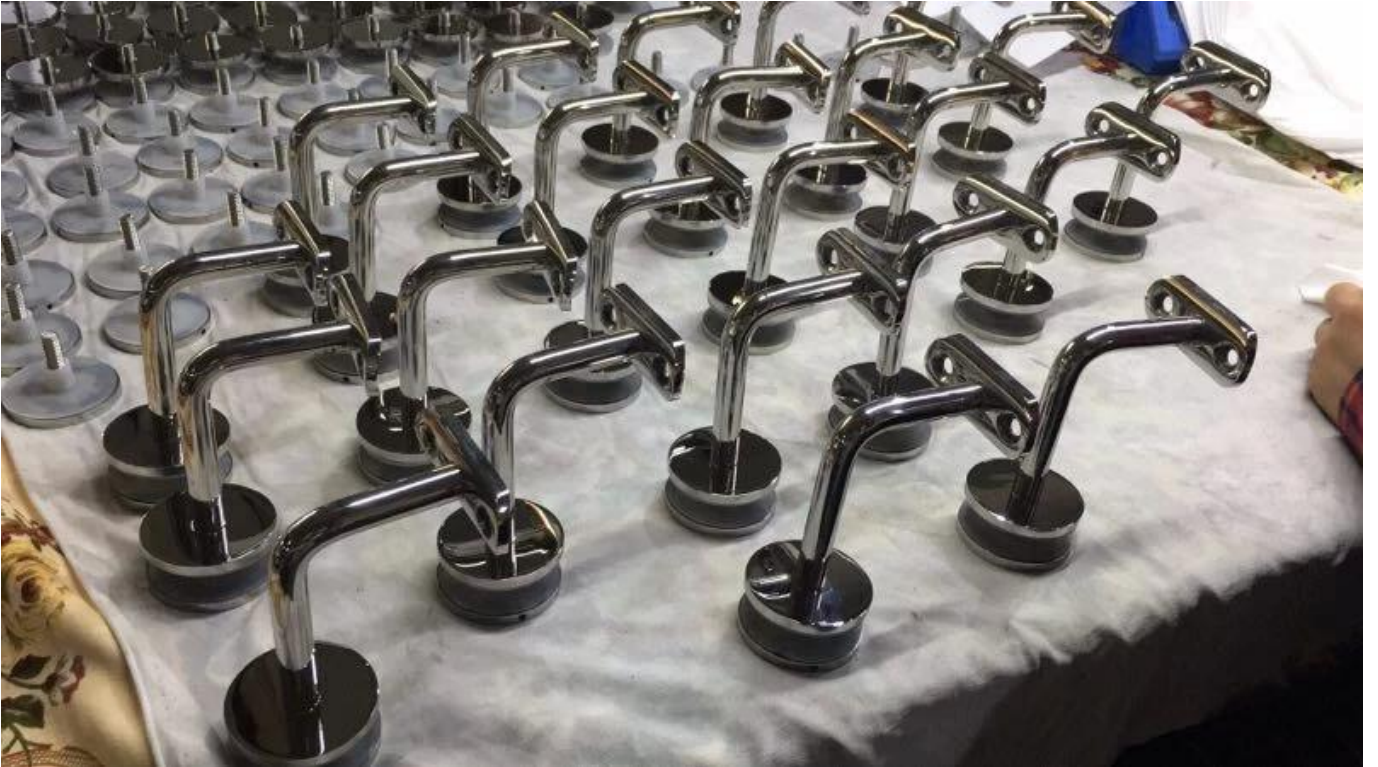
: الزجاج حديدي الفولاذ المقاوم للصدأ الحائط حامل درابزين صورة للرجوع اليها 3. : قابل للتعديل درابزين قوس داخلي في الهواء الطلق