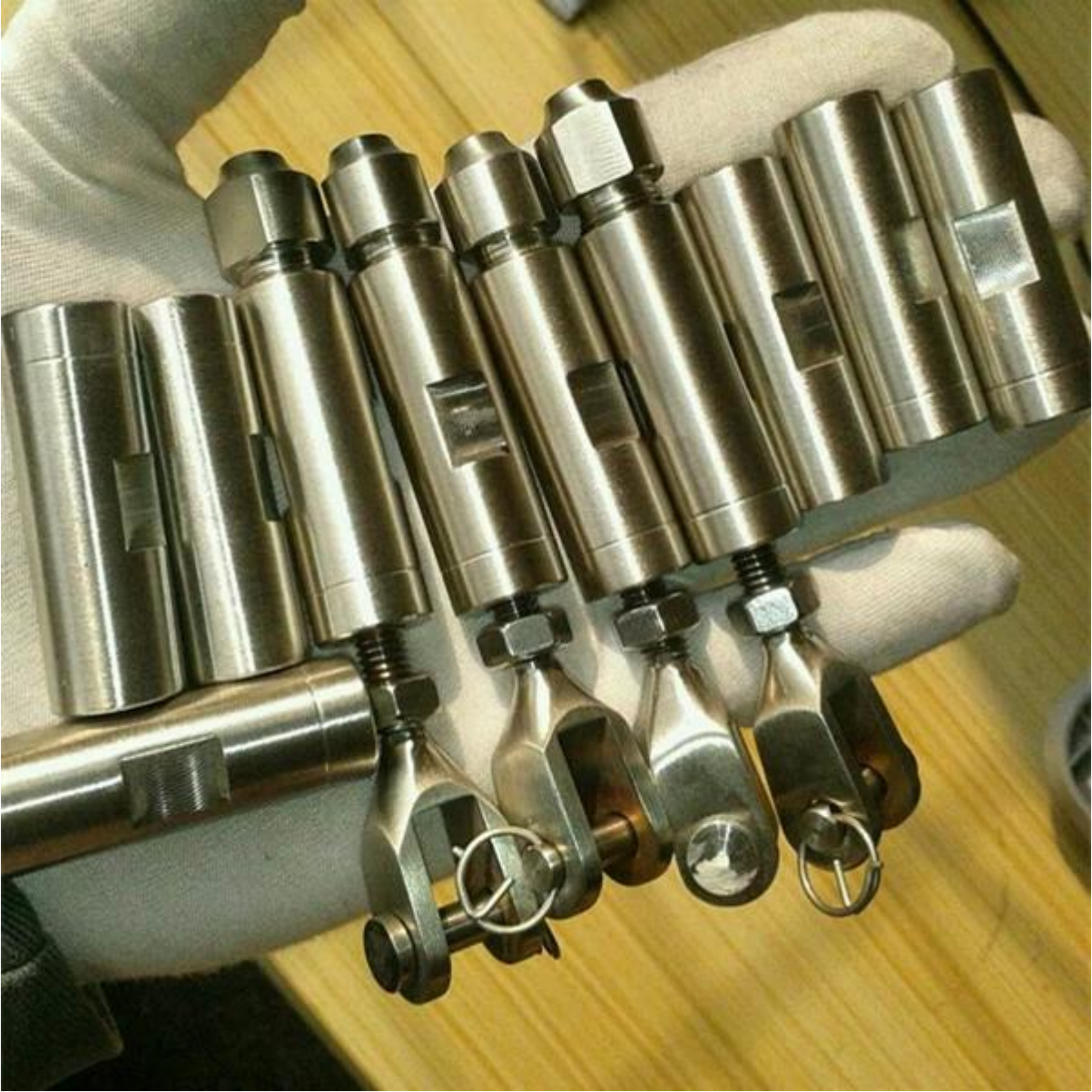
كاليفورنيا L.A المشروع في