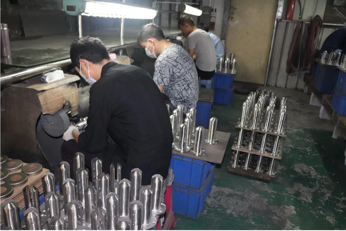
3. - صغير RBM صور مشروع عمود حنفية زجاجي.