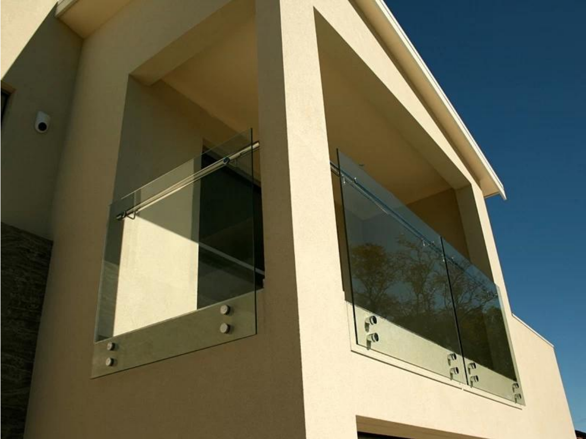
Система перил SF-50T