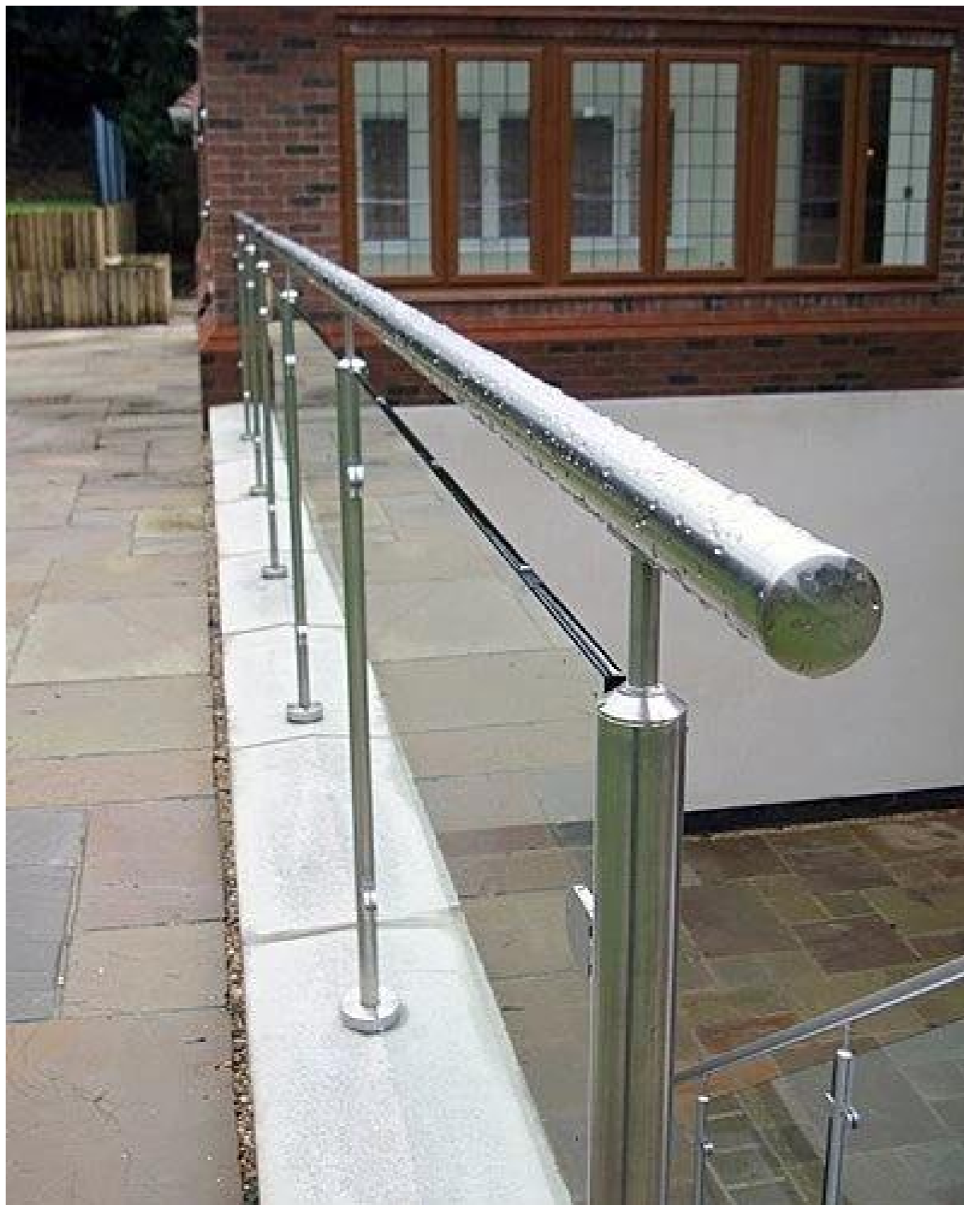
الفولاذ المقاوم للصدأ الدرابزين للشرفات في الهواء الطلق / جسر / حديدي