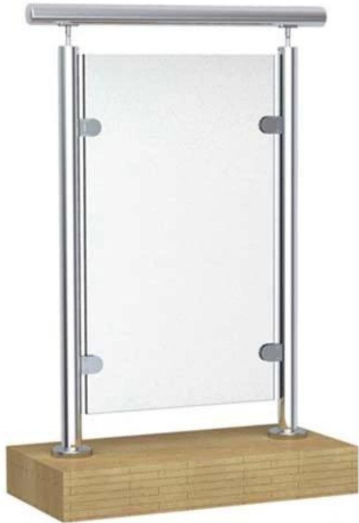
LCH-107: درجة ثنائية الاتجاه الأوسط 180: