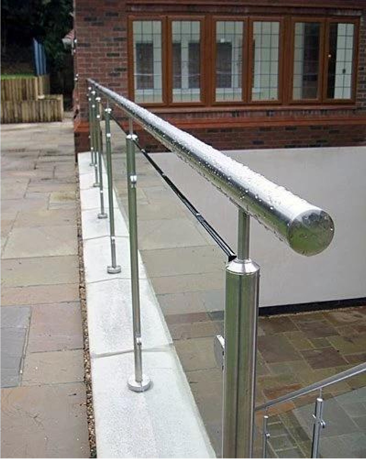
Terrance Design: الفولاذ المقاوم للصدأ الدرابزين للشرفات في الهواء الطلق / الجسر / حديدي