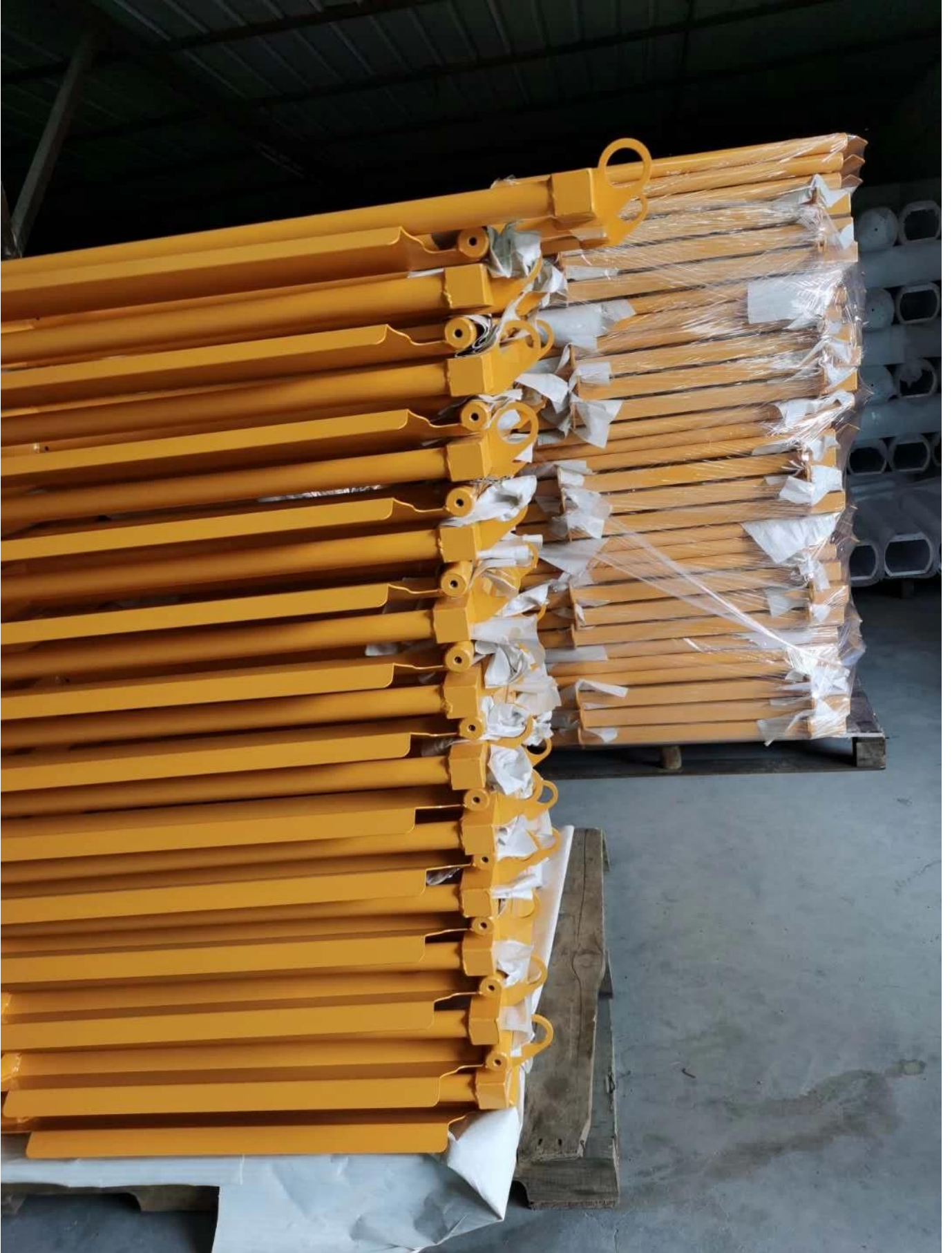
- درابزين أمان ألمنيوم مطبق في محطات السكك الحديدية #