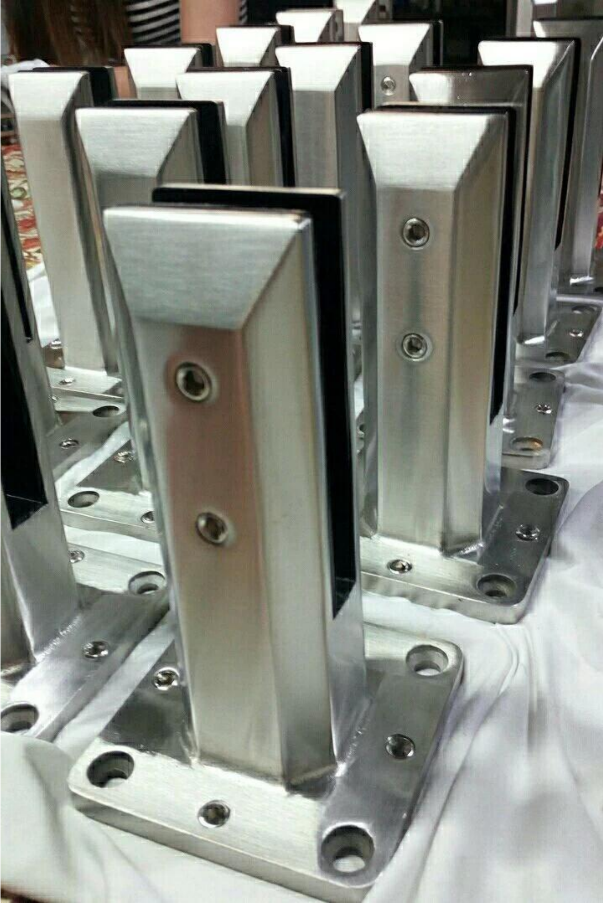
شبه-- الانتهاء من تعديل الزجاج موازنة حنفية الصور