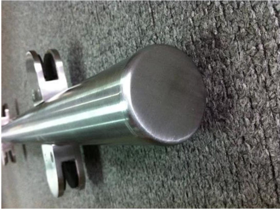
stainless steel end cap

هي التجهيزات درايزين الأخرى المتاحة 1.glass المشبك