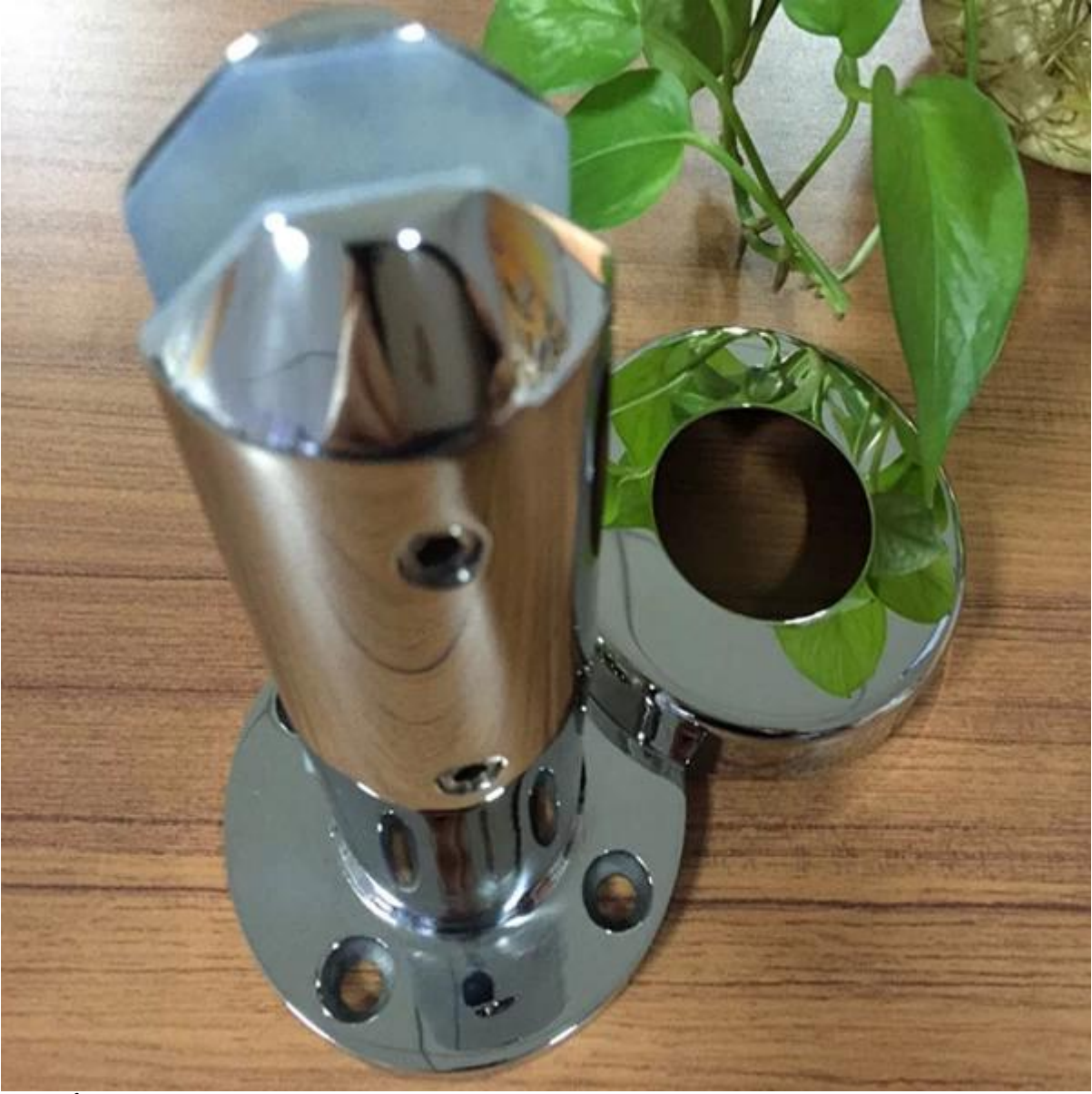
نوع الحفر الأساسية