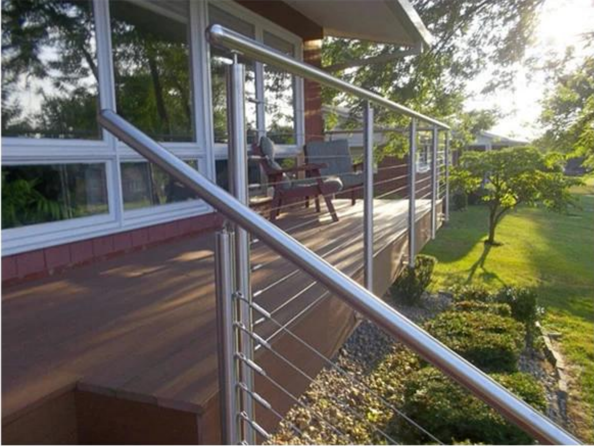
wire rope railing system