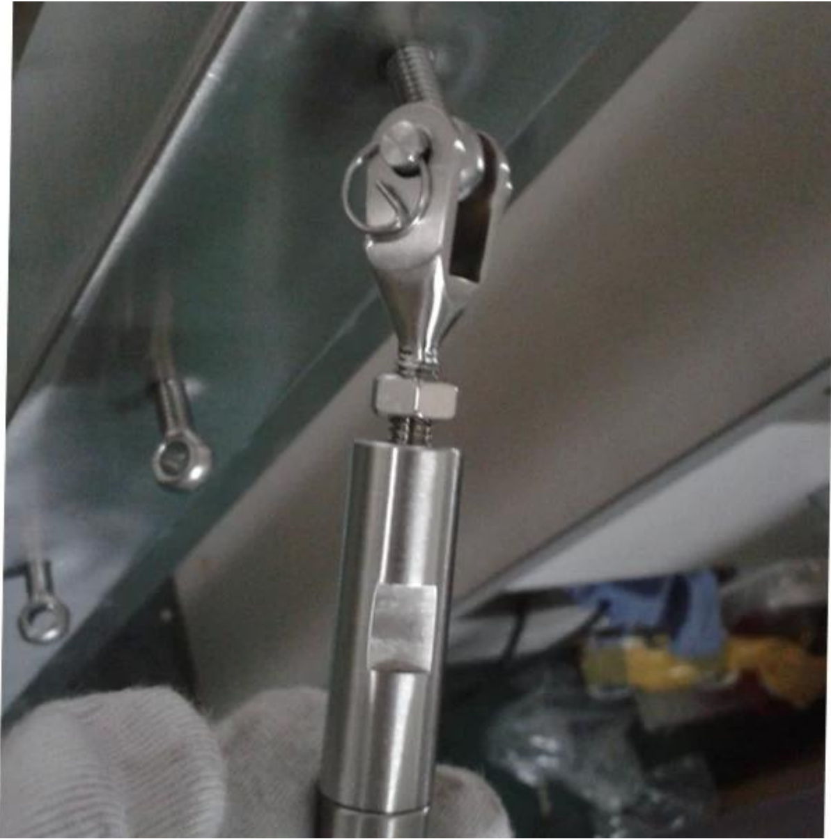
لوحة آخر مع القسم كابل 3.base