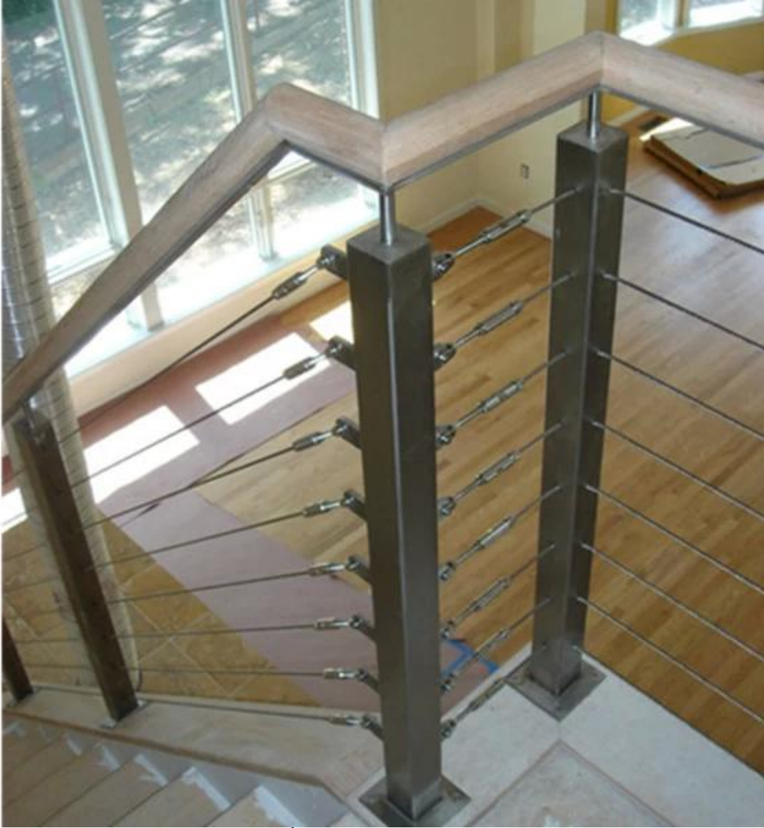
5.outdoor الفولاذ المقاوم للصدأ 316 كابل نظام حديدي متاحة