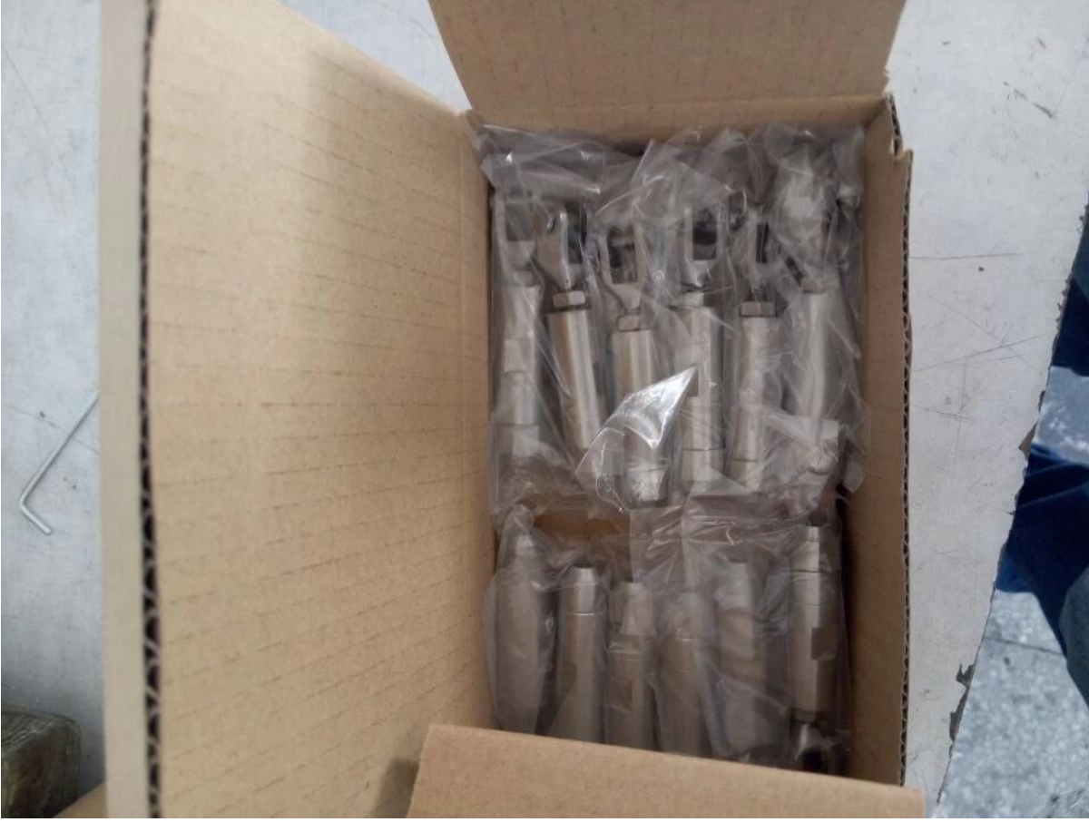
T803 الصور التركيب من كابل موتر