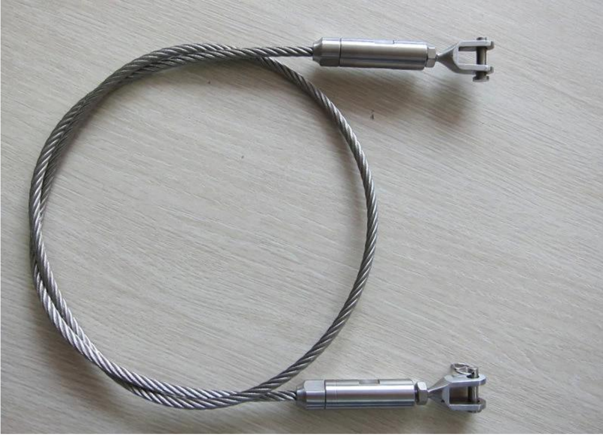
T803 هنا هو البعد من كابل موتر