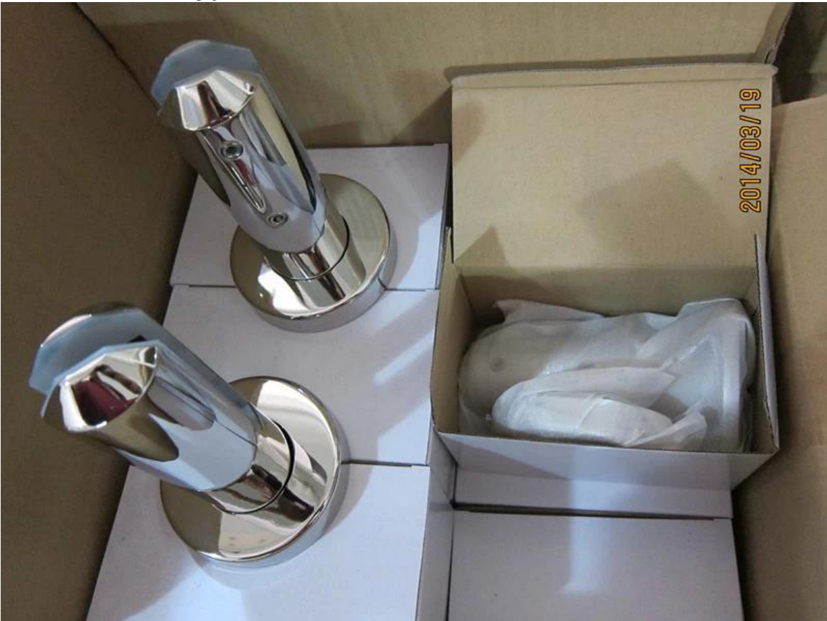
الفولاذ المقاوم للصدأ والزجاج حنفية متاح 316 درايزين الزجاج فرمليس لتصميم شرفة، خفف من الزجاج لنظام حديدي بركة السياج