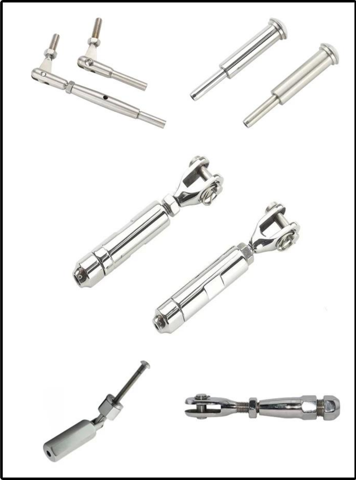
عرض المشاريع: اللفافة جبل السور كابل الفولاذ المقاوم للصدأ للسطح في الهواء الطلق -