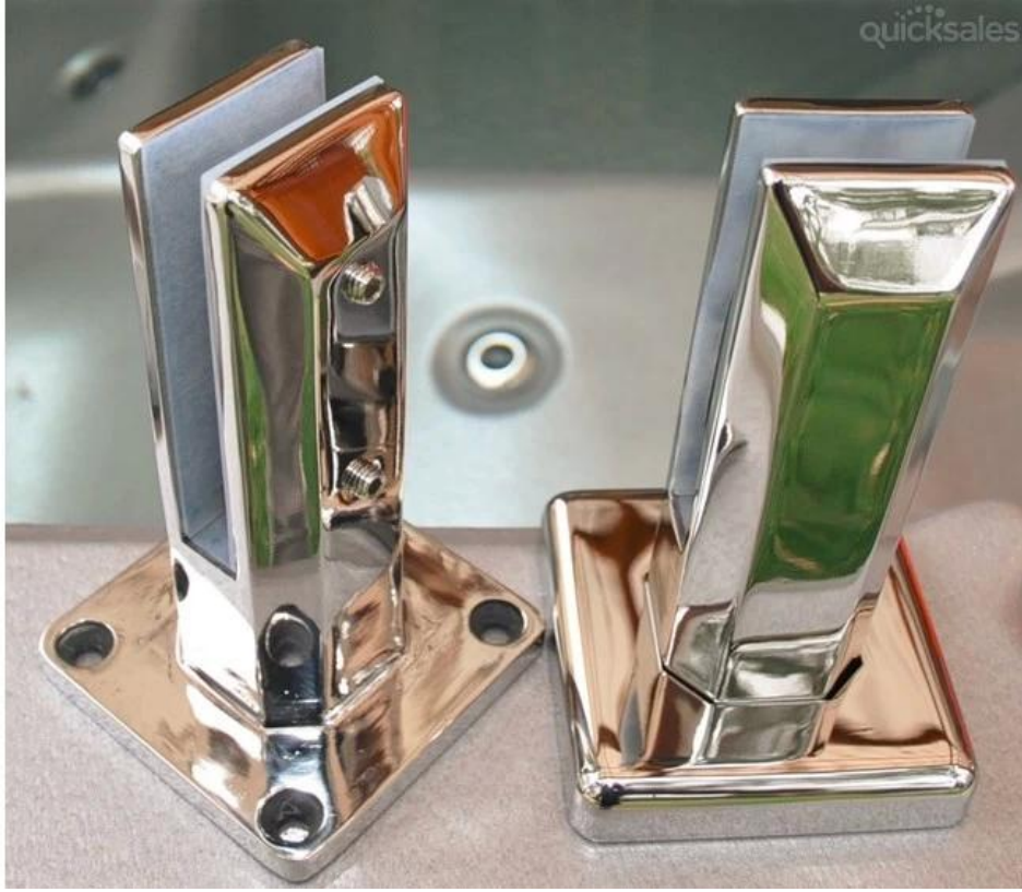
RCM حفر الزجاج حنفية الجولة core. نحي 3

الفولاذ المقاوم للصدأ 316 حولة زجاج الحفر الأساسية للحنفية حوض سباحة مصنع سور الصين، المصنع مباشرة حولة حنفية الزجاج الحفر الأساسية للشرفة