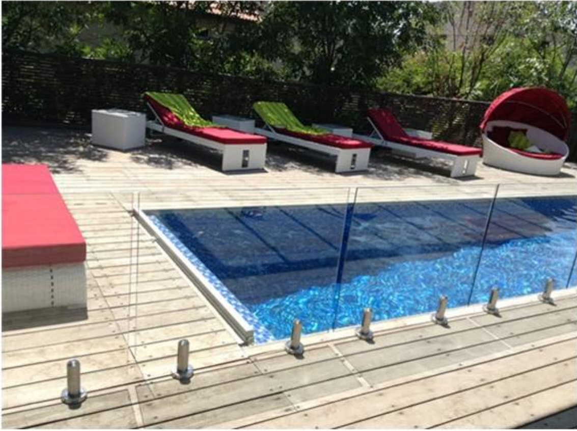
frameless glass balustrade