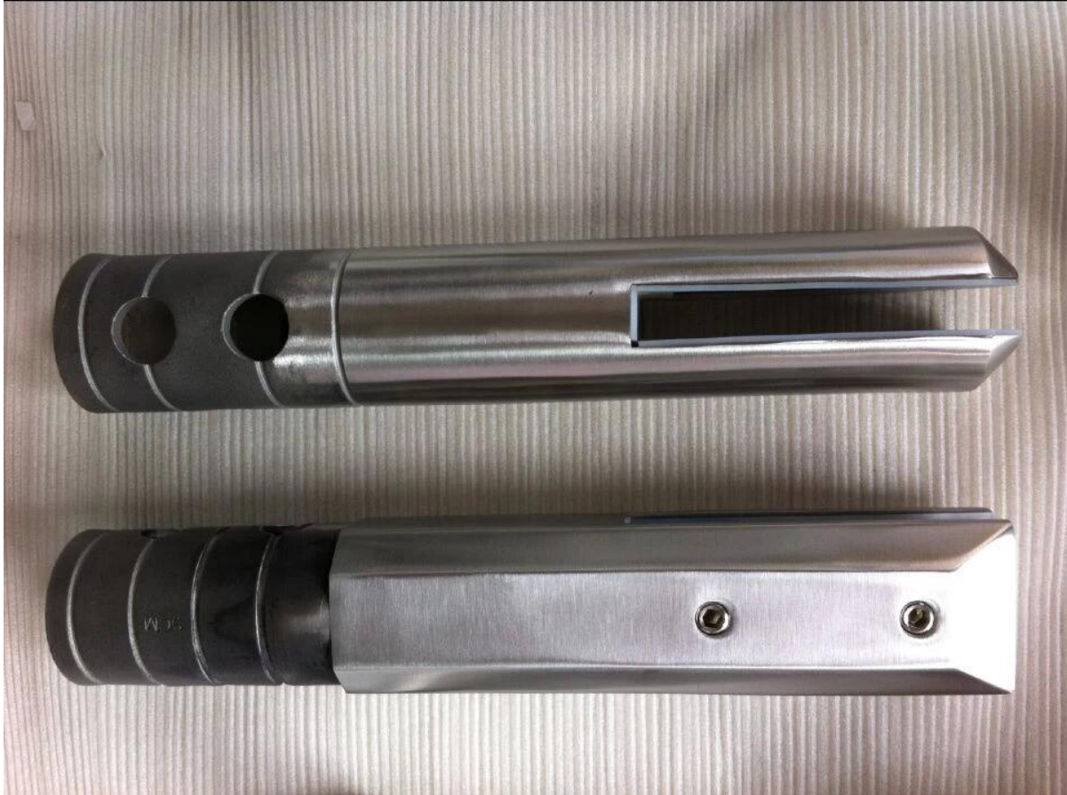
SCM مربع الزجاج الحفر حنفية brushed. الأساسية 4

الفولاذ المقاوم للصدأ 316 حولة زجاج الحفر الأساسية للحنفية حوض سباحة مصنع سور الصين، المصنع مباشرة حولة حنفية الزجاج الحفر الأساسية للشرفة