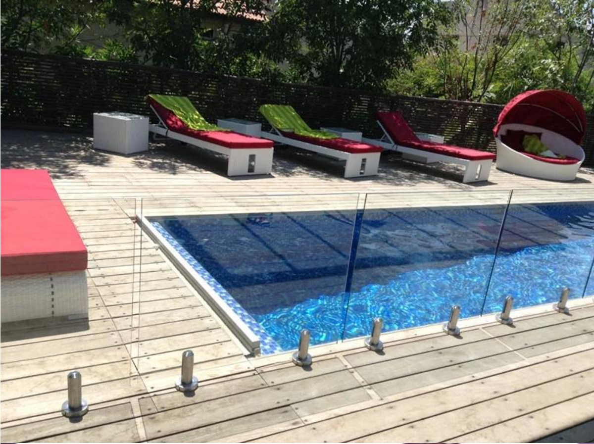
frameless glass railing with spigot