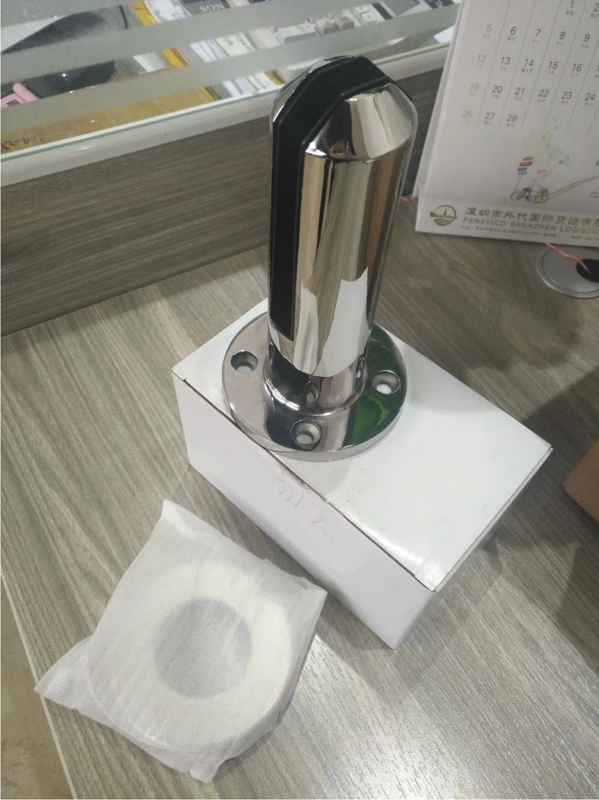
٣. حنفية الزجاج للرجوع اليها.