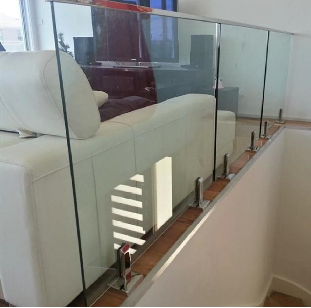
شكل مربع الفولاذ المقاوم للصدأ للقضبان أعلى الحزمة MM الزجاج حديدي 20 * 25.