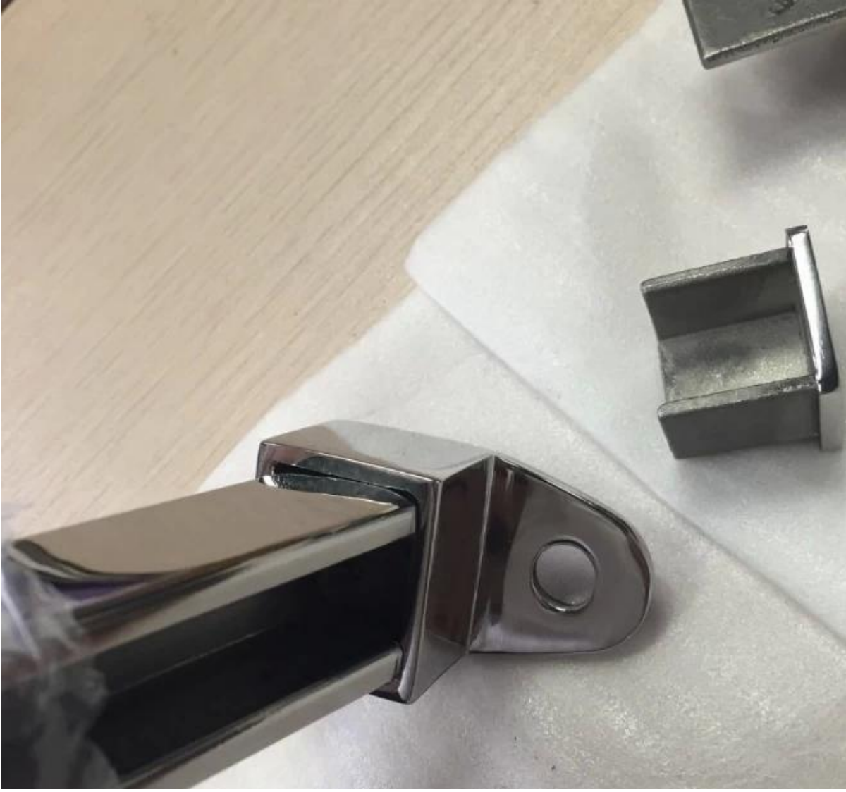
شكل مربع الفولاذ المقاوم للصدأ القضبان كبار المشروع MM الزجاج حديدي 20 * 25 .3