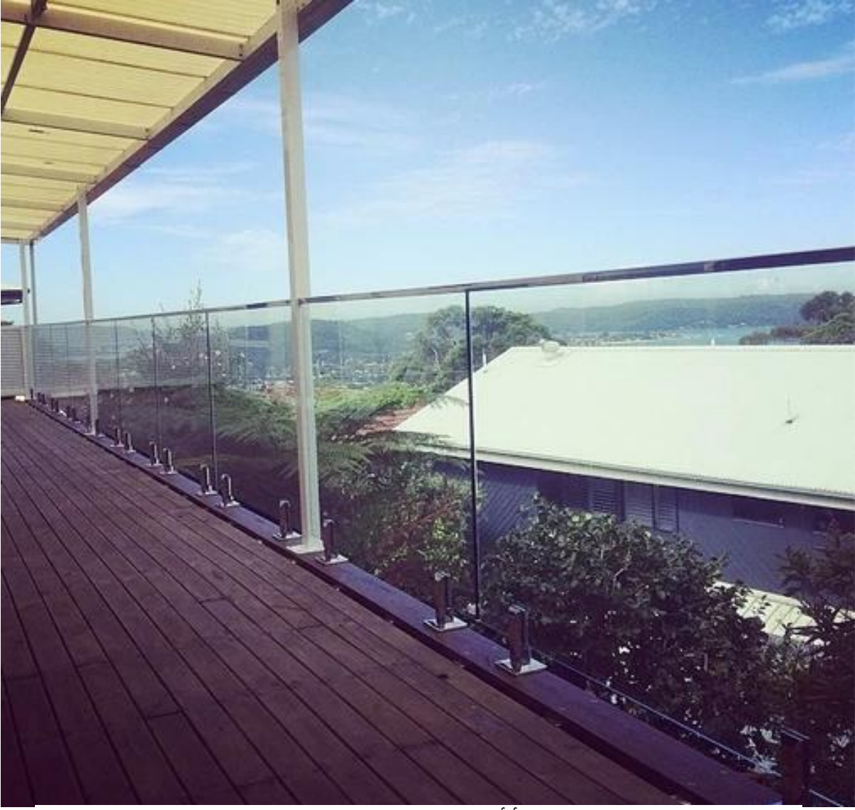
2): درايزين من الصلب المقاوم للصدأ أنبوب فتحة سطح السفينة في الهواء الطلق زجاج السور.