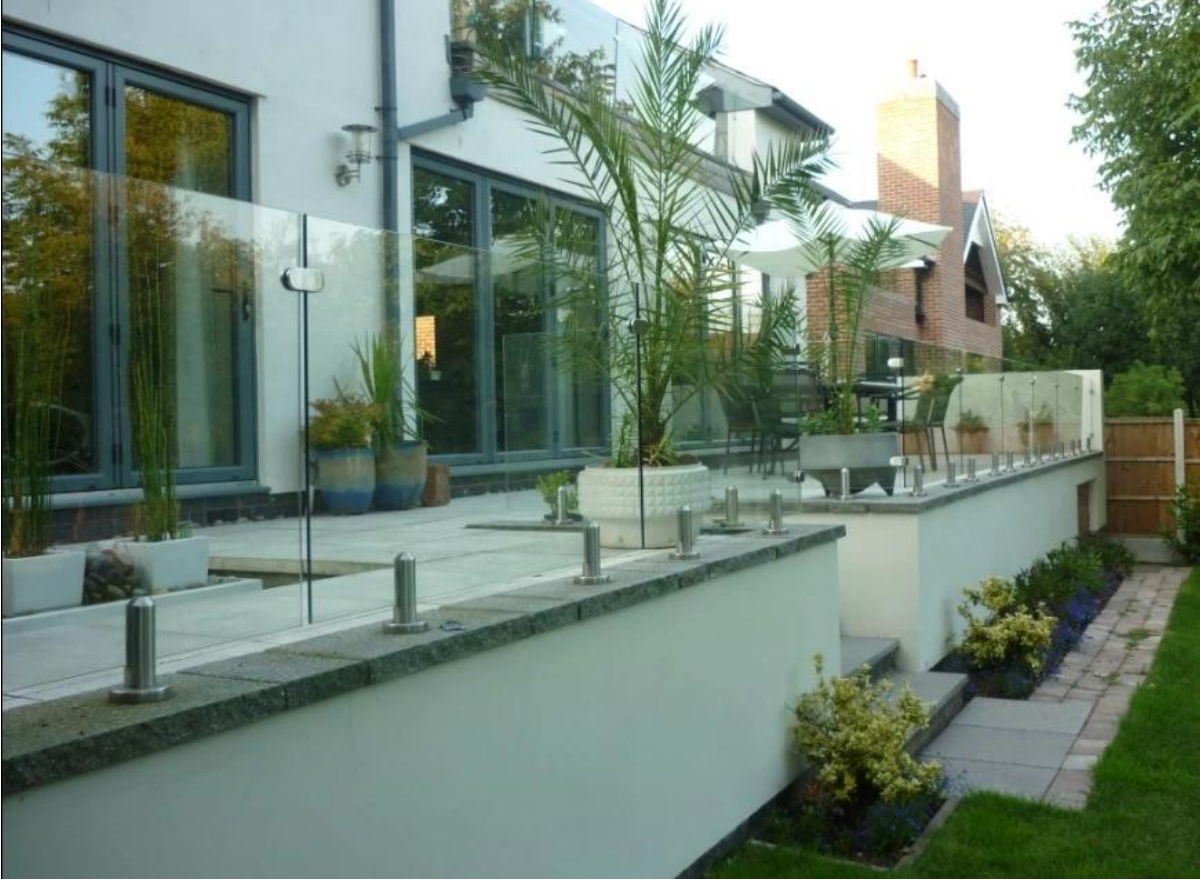
الألواح الزجاجية واضحة للتجمع المبارزة 10-12mm