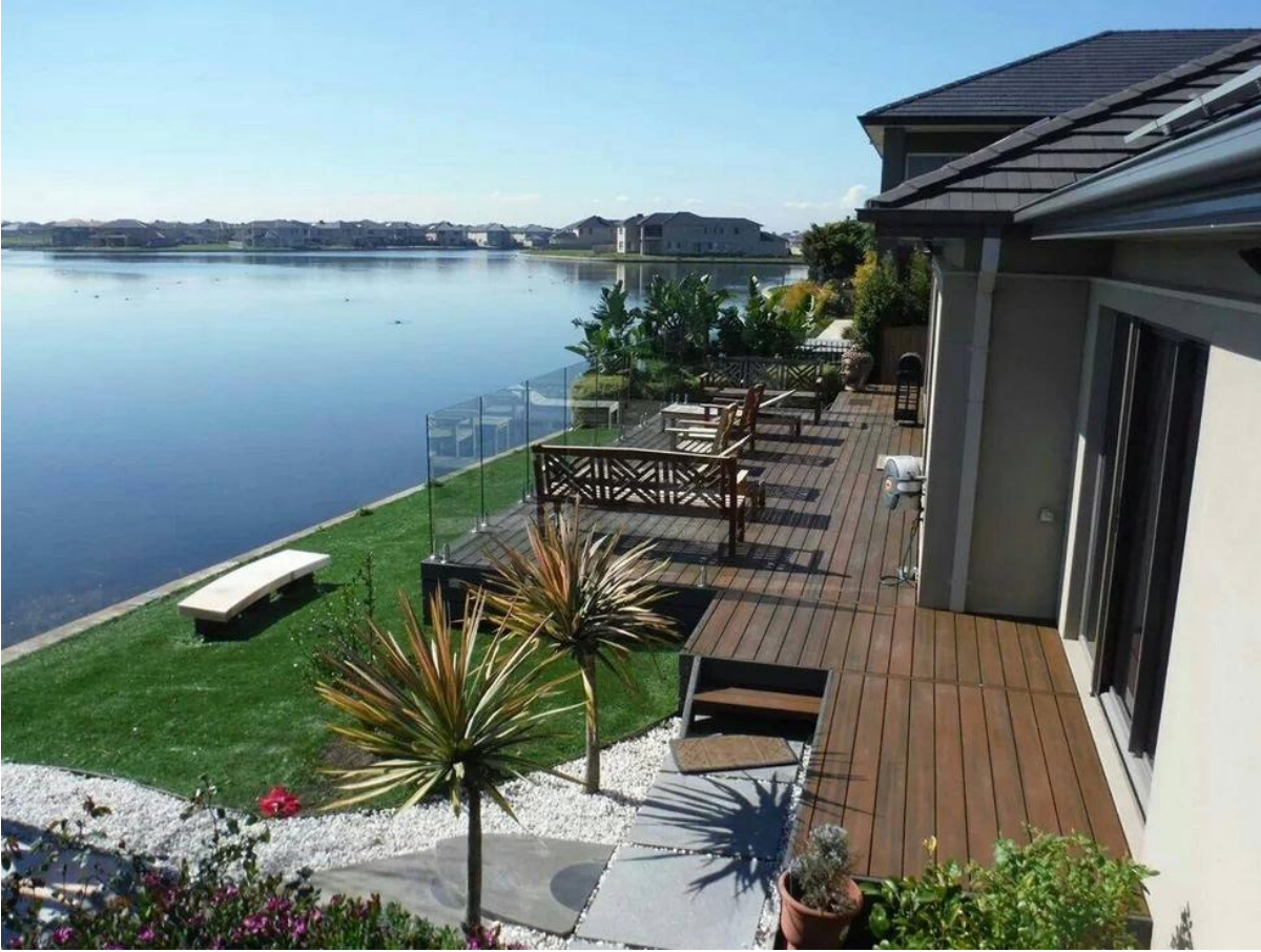
زجاج فرميس حمام السباحة المبارزة: