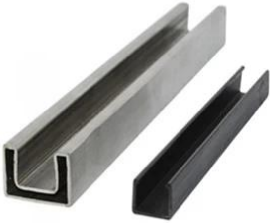
square top rail