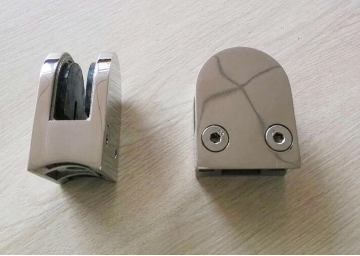
شکل دائري الصورة الفولاذ المقاوم للصدأ لمشروع مقطع زجاج .2